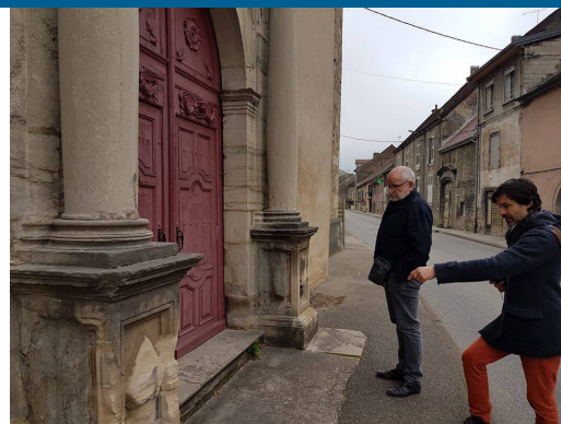
Interventions nécessaires à Notre Dame de Conliège

Des travaux conséquents de reprise de la charpente du chœur seront effectués dès que l'architecte aura terminé son étude.